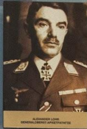
ALEXANDER LÖHR GENERALDEREICH (4 STAR RANK)