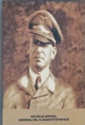
WILHELM SPINDEL GENERAL DEL FLIEGER (3 STAR RANK)