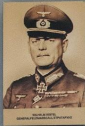
WILHELM KEITEL GENERALFELDMARSCHALL (5 STAR RANK)