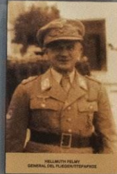
HELLMUTH FELBER GENERAL DEL FLIEGER (3 STAR RANK)