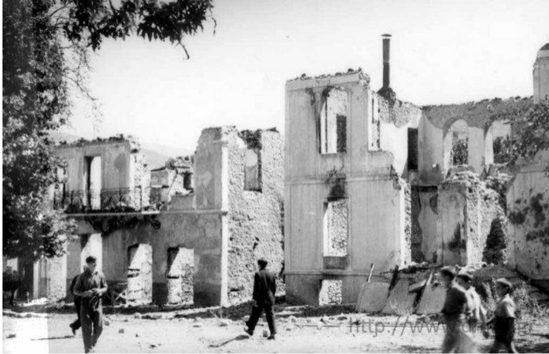
Τα Καλάβρυτα την επόμενη μέρα της καταστροφής