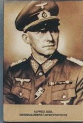
ALFRED JODL GENERALDEREICH (4 STAR RANK)