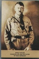
ADOLF HITLER CHANCELLOR AND DICTATOR OF NAZI GERMANY