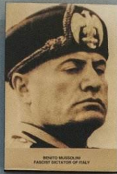
BENITO MUSSOLINI FASCIST DICTATOR OF ITALY